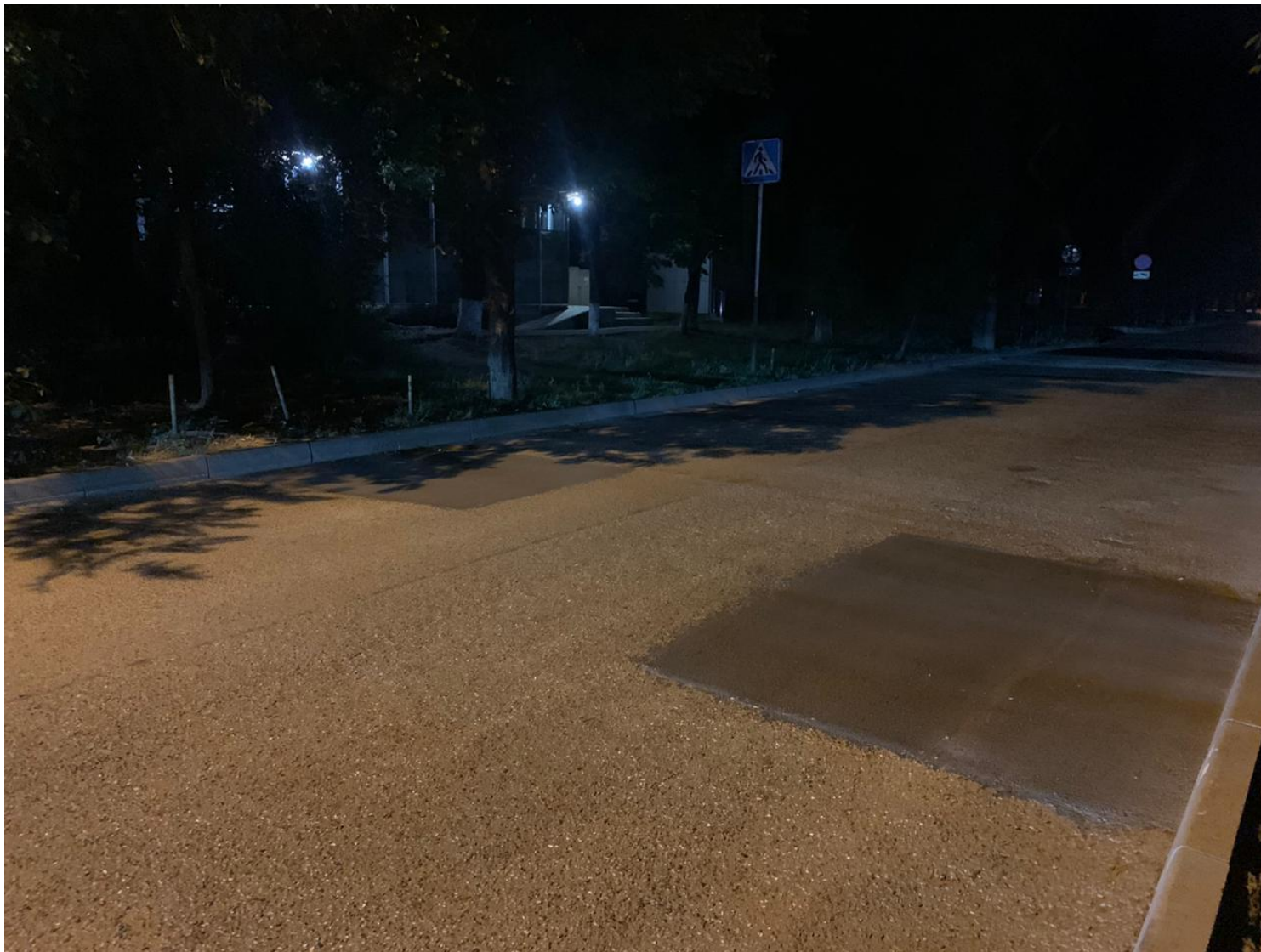
ул. Айвазовского (75 м2)