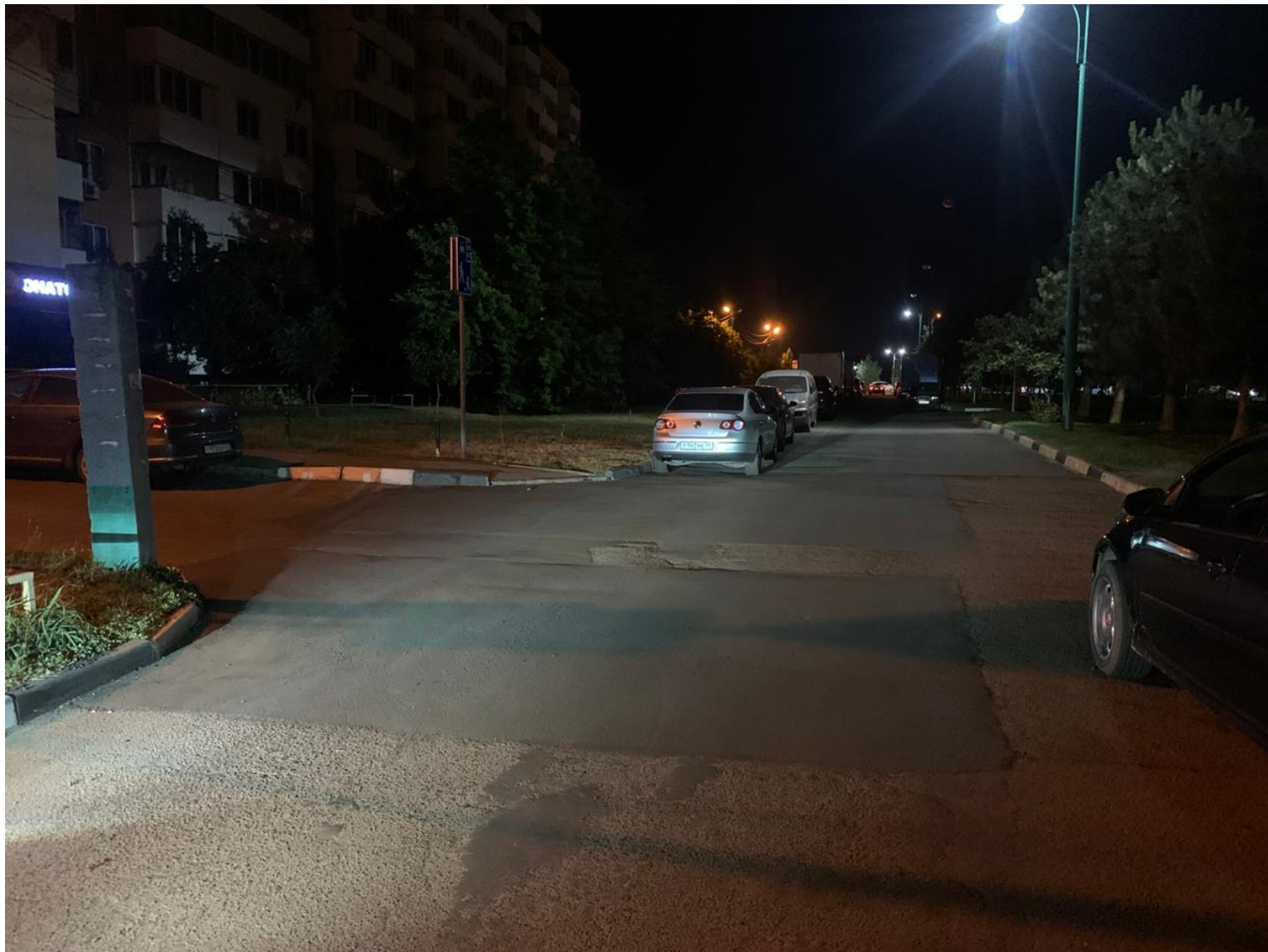
ул. Бульвар Платановый (100 м2)