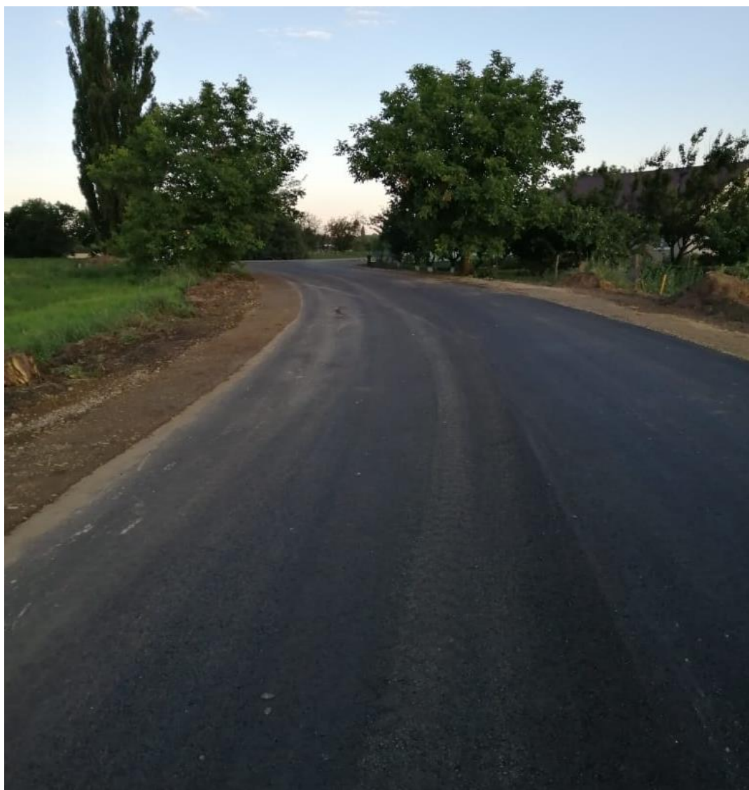
Центральная в пос. Лазурном (восстановление дорожной одежды) (2413 м 2 )