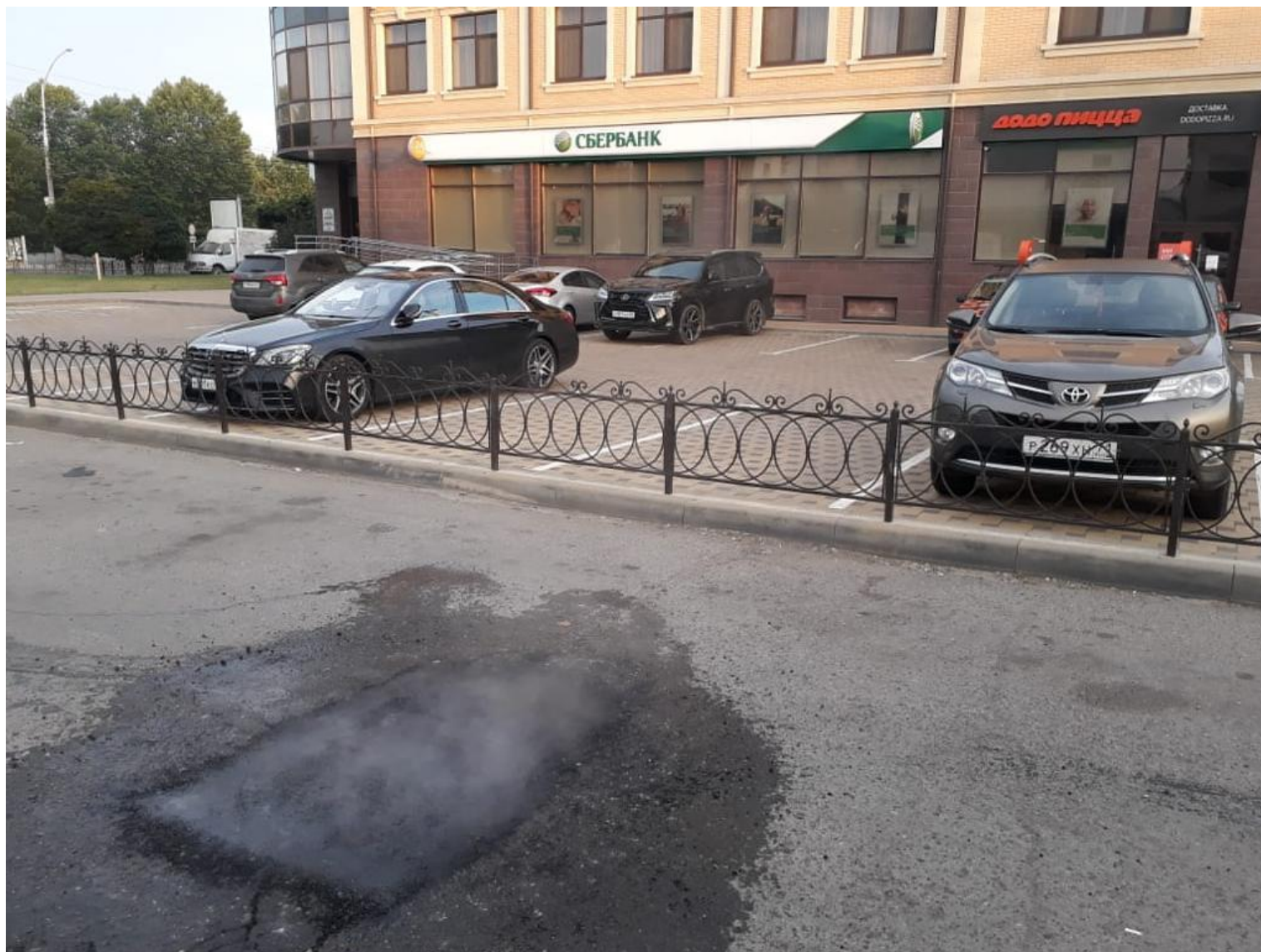
ул. Панфилова (1 м2)