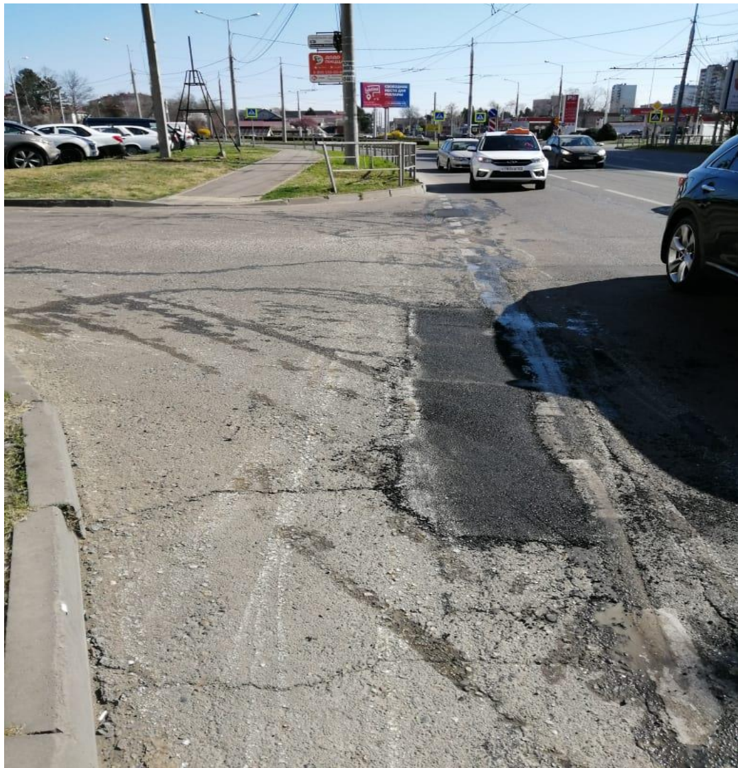
пересечение ул. 70-летия Октября и ул. Думенко (5,4 м 2 )