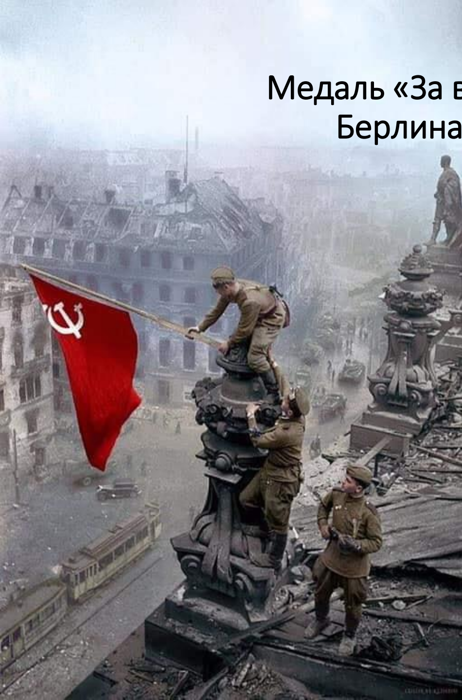
Медаль «За взятие Берлина»